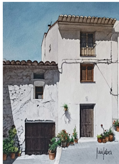
JERICA 38 X 53