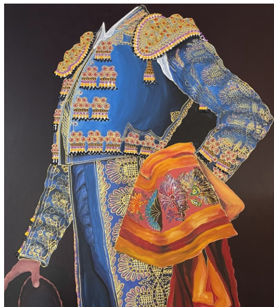
AZUL MEDITERRANEO CON CAPOTE DE CLAVELES Y ORO 92 X 73