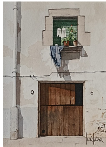
VISTABELLA 28 X 38