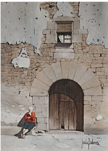
RUPIT (Girona) 38 X 53