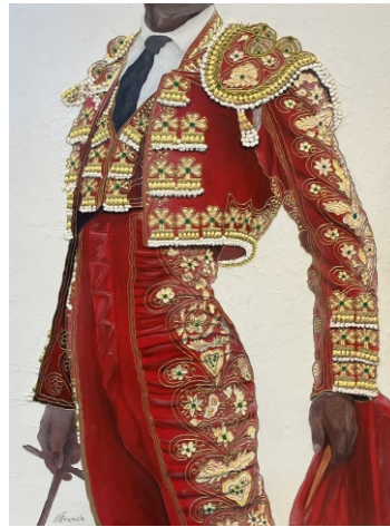
ROJO CADMIO MEDIO Y ORO 92 X 73