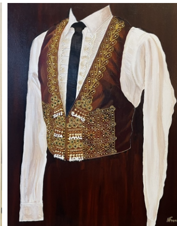
CHALECO DE TORERO 81 X 65