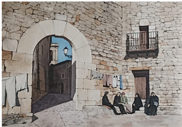
CULLA 53 X 38