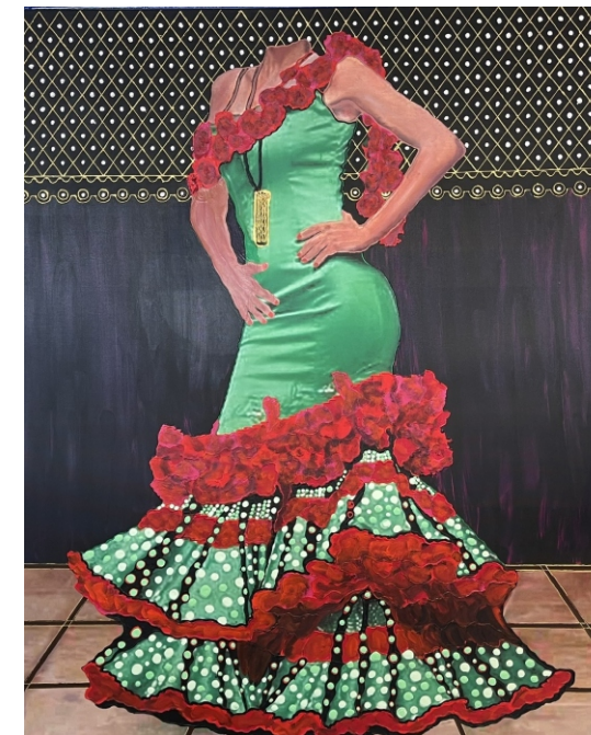
TRAJE DE FLAMENCA VERDE Y ROJO 116 X 89