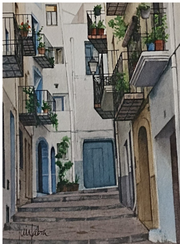
PEÑÍSCOLA 28 X 38