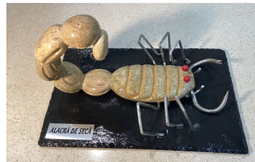
ALACRÀ DE SECA