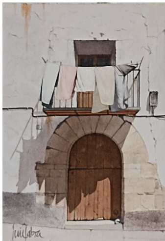
ROPA TENDIDA 28 X 38