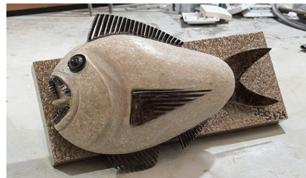
PEZ DE ROCA