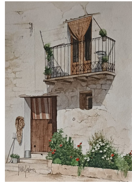
PORTELL 38 X 53