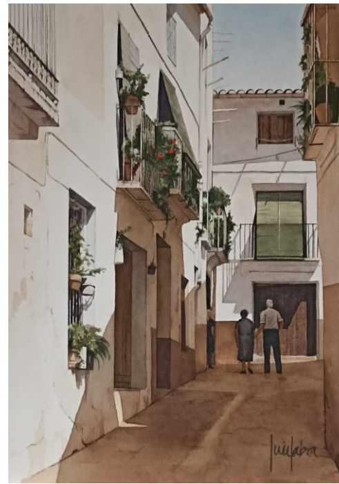
CASTELLNOVO 38 X 53