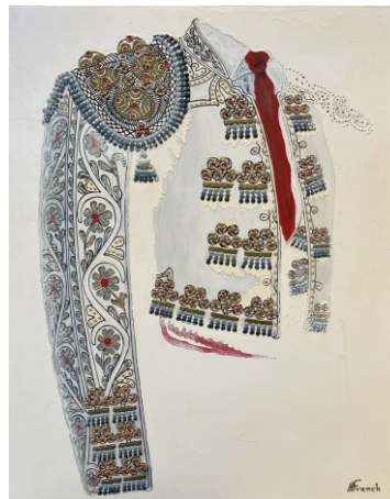
PERLA BLANCO Y ORO 81 X 65