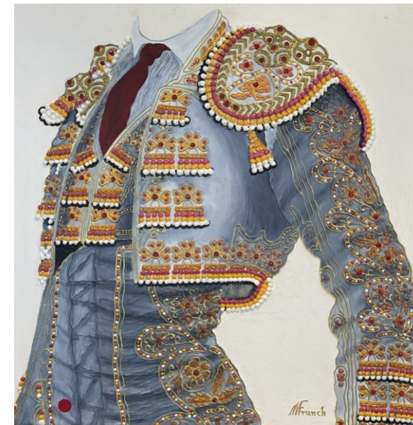
GRIS CON FONDO BLANCO 60 X 60