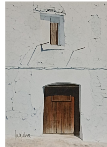
AHIN 28 X 38