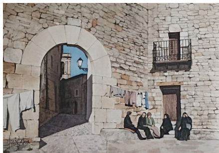
CULLA 53 X 38