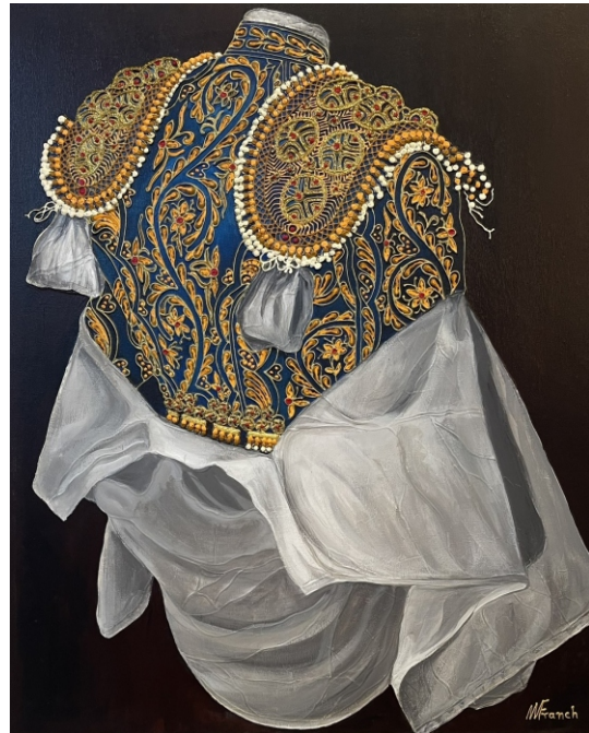
AZUL Y ORO CON CAMISA PARA TRANSPORTAR 81 X 65