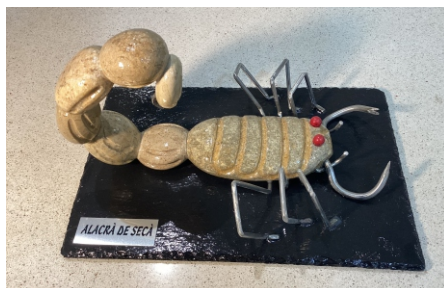
ALACRÁ DE SECA