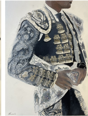
BLANCO Y NEGRO 92 X 73