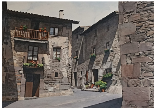
RUPIT (Girona) 53 X 38