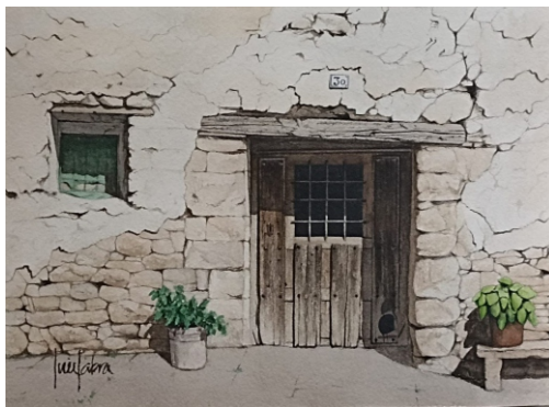
PUERTA CON VENTANA 53 X 38