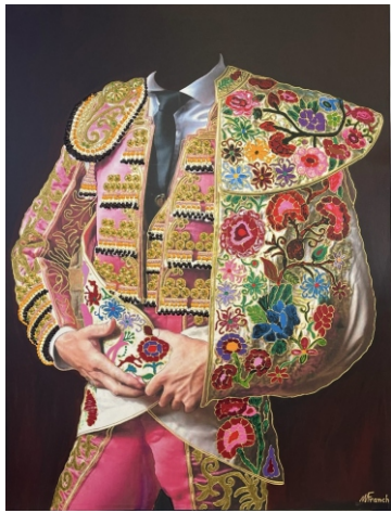
FUCSIA CLARO Y ORO CON CAPOTE FLOREADO 116 X 89