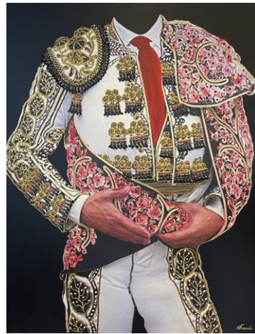
BLANCO PERLA Y ORO CON CAPOTE DE PETALOS DE ROSA 116 X 89