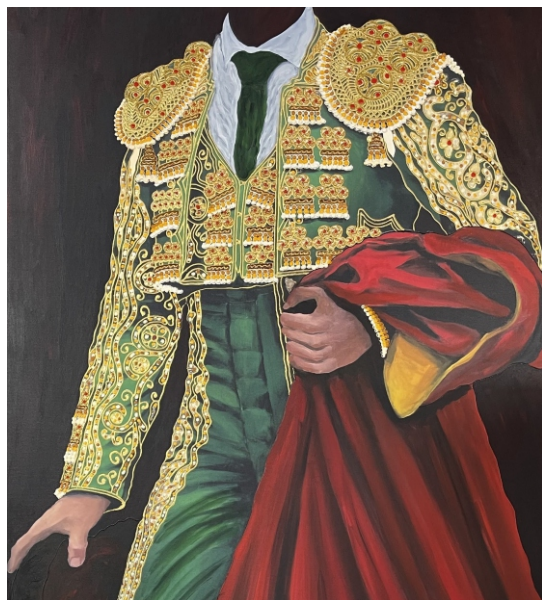
VERDE Y ORO 100 X 65