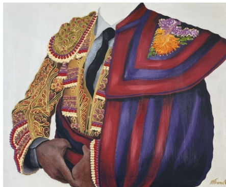
ALBERO Y ORO CON CAPOTE DE PASEO AZUL Y GRANA 55 x 46