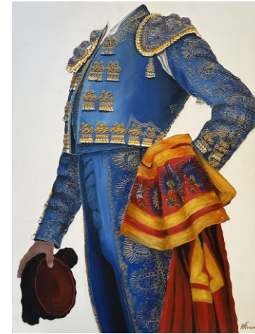
AZUL MEDITERRANEO CON CAPOTE DE CLAVELES Y ORO 92 X 73