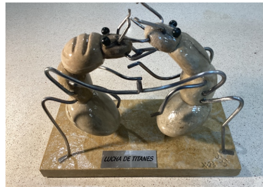
LUCHA DE TITANES