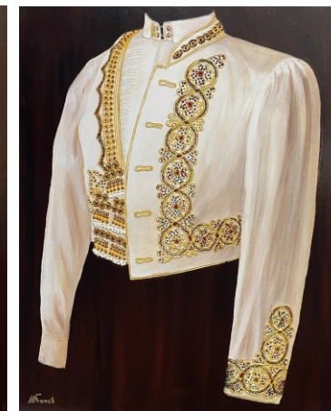
CHAQUETA DE REJONEADOR 81 X 65