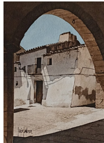
BENASAL 28 X 38