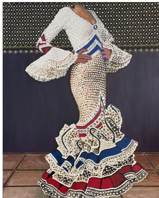
TRAJE DE FLAMENCA BLANCO, AZUL Y ROJO 116 X 89