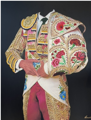
MAGENTA Y ORO CON CAPOTE DE CLAVELES 116 X 89