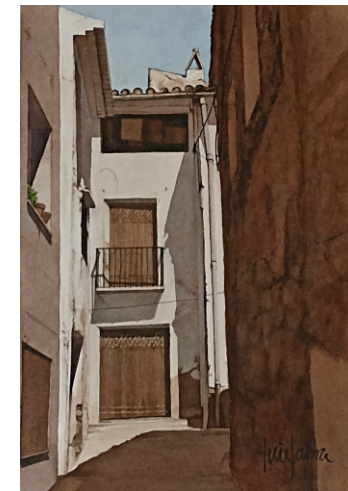
ALGIMIA 28 X 38