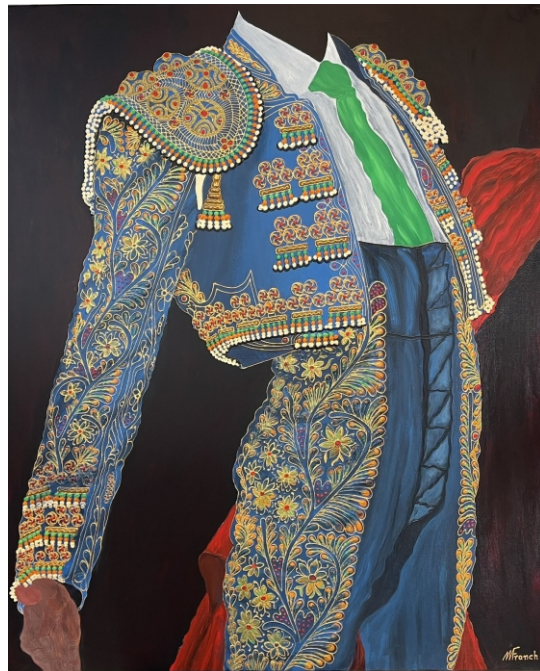
AZUL CELESTE 100 X 81