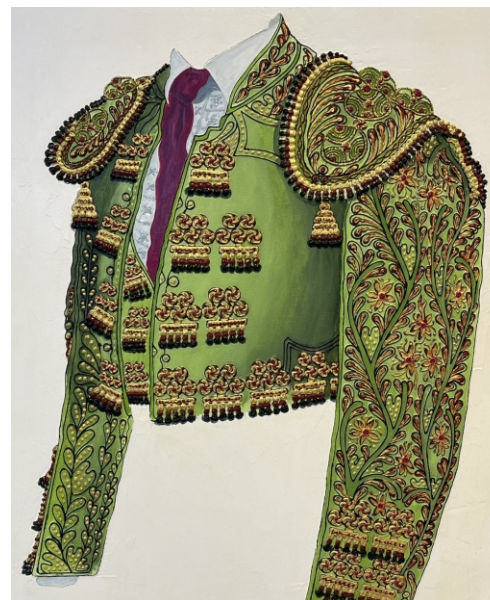
VERDE MANZANA Y ORO 81 X 65